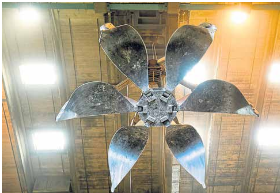
Von 17 bis 22 Uhr bietet die MVA Ingolstadt stündliche Führungen durch die Anlage an.

Bei kostenlosem Eintritt bietet die MVA Ingolstadt am Freitag, den 5. Mai von 17 bis 22 Uhr stündliche Führungen durch die Anlage an. Doch die Lange Nacht verbindet an diesem Abend nicht nur Kunst und Technik ausschließlich in der Müllverwertungsanlage. Auch weitere Firmen und Bildungseinrichtungen aus der ganzen Region öffnen hier ihre Türen. Die IRMA hat in Zusammenarbeit mit den teilnehmenden Unternehmen ein vielfältiges Programm auf die Beine gestellt. Bei einem Streifzug durch die Lange Nacht kann bei den 45 Teilnehmern ein buntes Programm entdeckt werden. Auch Kultur- und Kreativinteressierte kommen in den Genuss. Die teilnehmenden Unternehmen bieten auch ein abwechslungsreiches Kreativprogramm, wie bei der MVA Ingolstadt Kunstwerke von der selbstständigen Künstlerin Edith Rohde. Ebenso sind viele weitere regionale Künstlerinnen und Künstler sowie Kunst-Vereine etc. mit von der Partie. Mehr dazu finden Sie auf www.mva-ingolstadt.de . Dort finden Sie auch die Broschüre der Langen Nacht der Unternehmen und Wissenschaft zum Download.