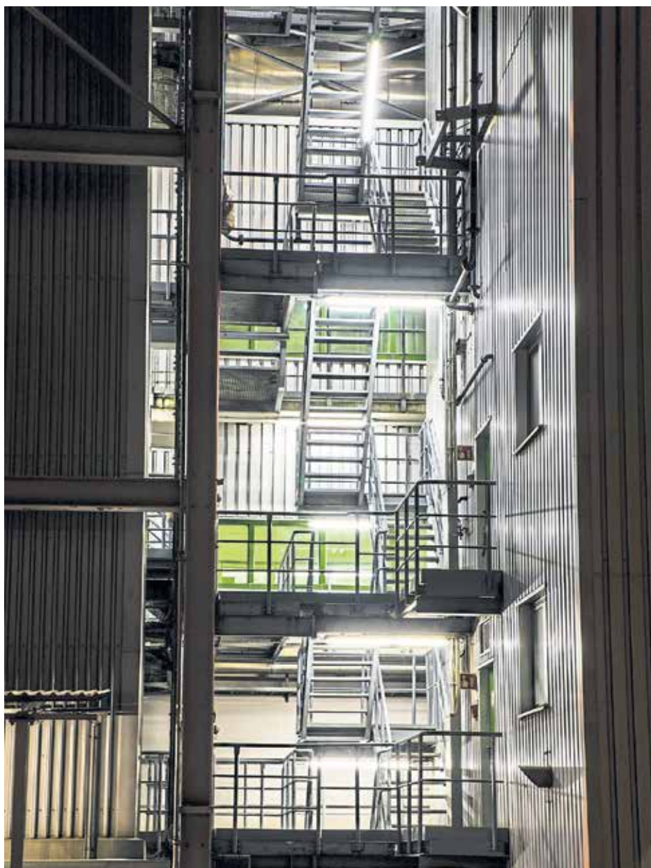
Bestaunen Sie in luftiger Höhe die wunderschöne Natur vom Dach der Müllverwertungsanlage.